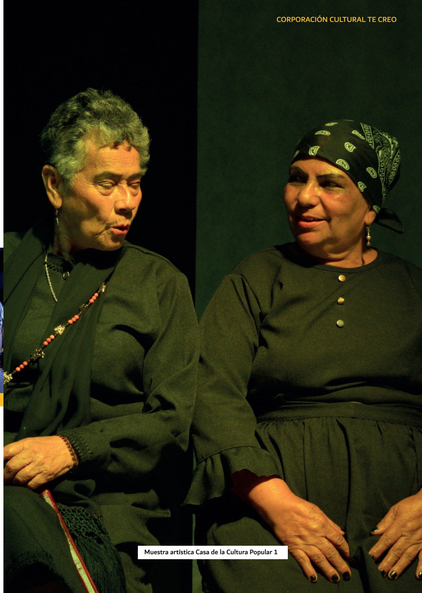
Muestra artística Casa de la Cultura Popular 1