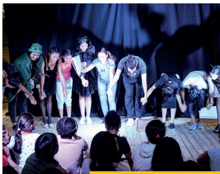
Muestra La Chinca

Es una estrategia descentralizada que busca llevar de manera gratuita la formación artística a diferentes espacios de ciudad o rural, beneficiando a niños y jóvenes del municipio de Medellín o sus alrededores, con montajes teatrales a partir de la Metodología del Teatro para la Experiencia, que promueve construcción de ciudadanía, el fortalecimiento de la resiliencia de manera individual y colectiva, a través de la premisa: El arte para vivir mejor.