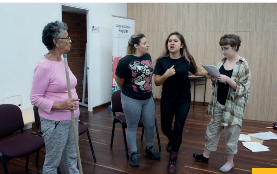
Ensayos Casa de la Cultura Popular 1